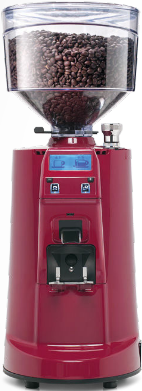
MDXS ON DEMAND