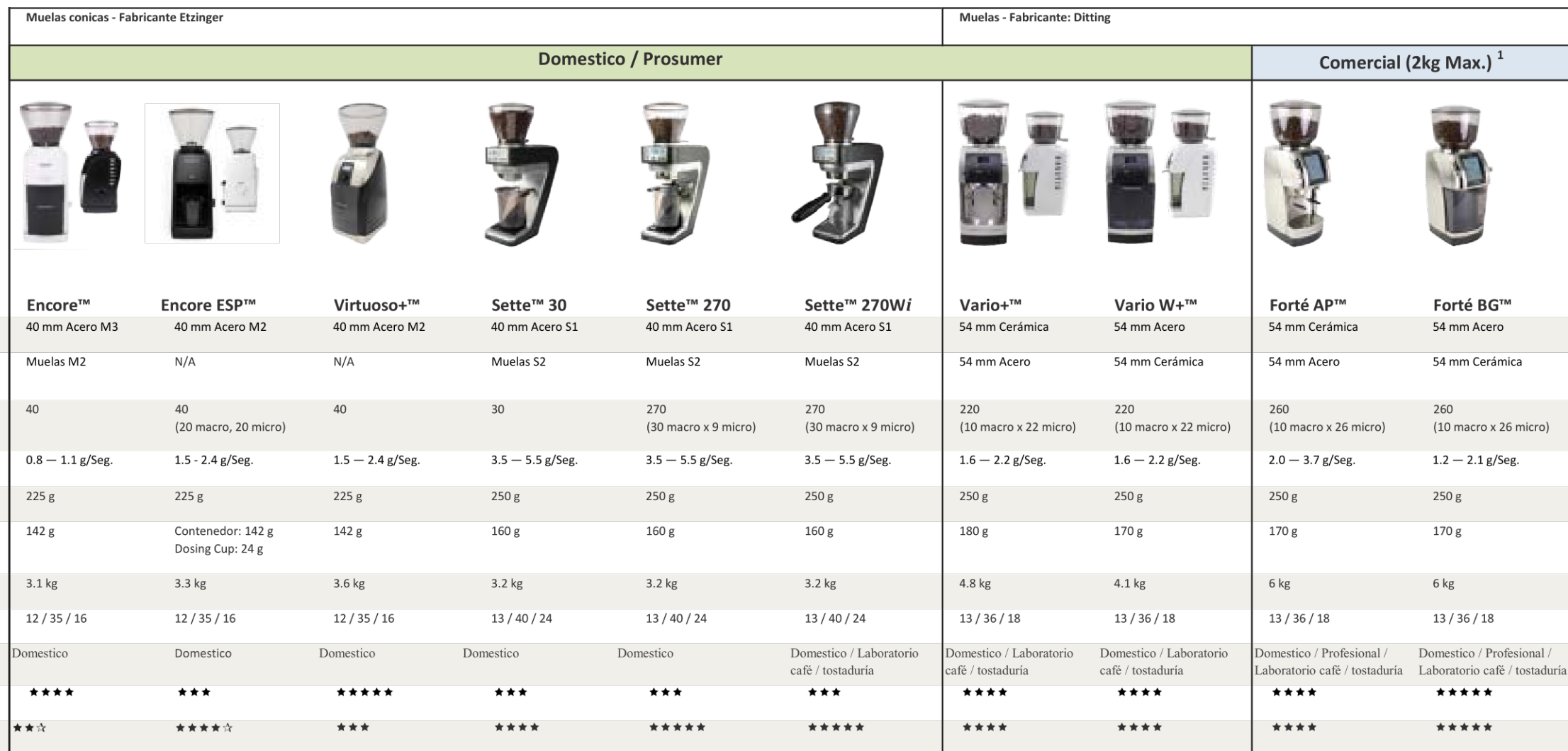
Tabla comparativa de molinos